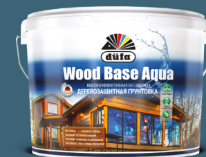
WOOD BASE AQUA грунтовка для древесины

Для достижения идеального результата в комплексе с WOOD COLOR мы рекомендуем использовать специальную блокирующую грунтовку на водной основе düfa WOOD BASE AQUA .